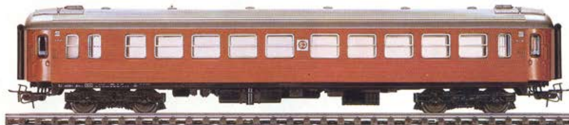
4073 · Restaurangvagn · Statens Järnvägars litt R 1 · RELEX-koppel · Längd 24,4 cm · Kan försees med vagnsbelysning 7197