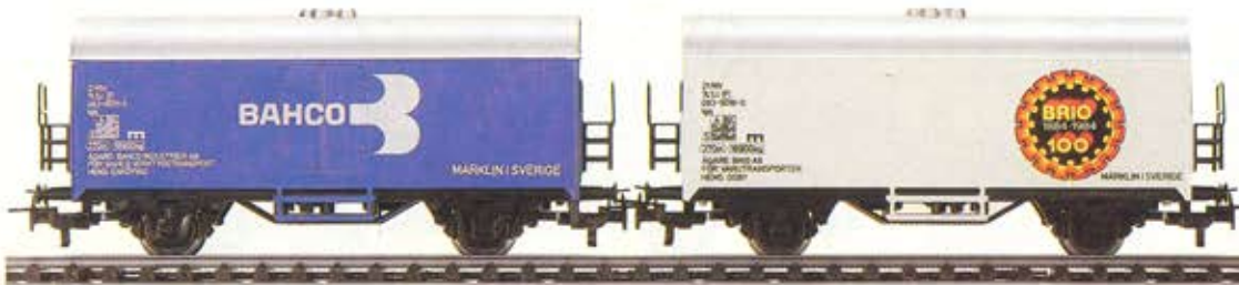
4415-7 · Sluten godsvagn · Privatvagn BRIO · RELEX- koppel · Längd 11,5 cm